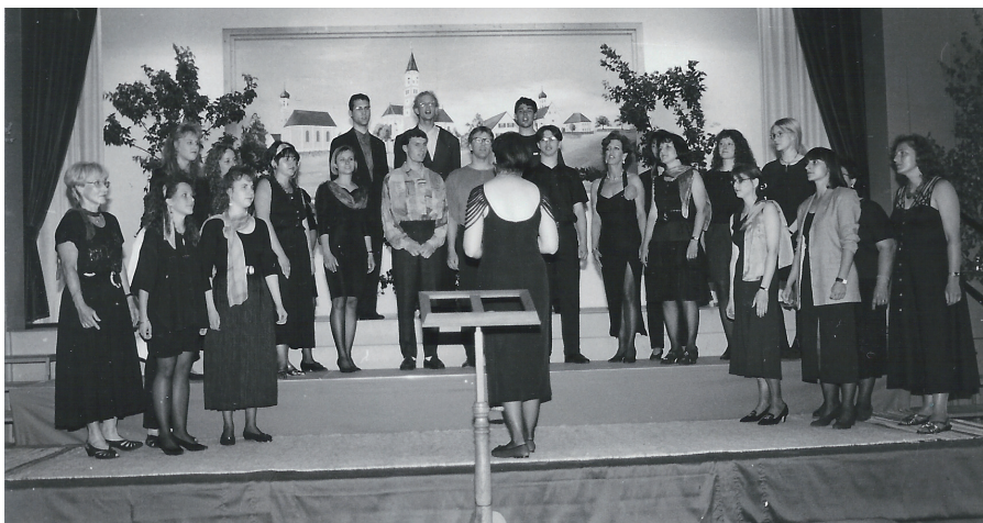
Foto von einem der ersten Auftritte am 02.07.1995 in Blindheim

Sie sagte zu, die Leitung eines „Jazz-Chores“ im Landkreis Dillingen zu übernehmen. Es sollte im Herbst losgehen. Zur Vorbereitung nahm die Dirigentin in spe am Jazzfestival in Burghausen teil und fing an, passende Literatur für ihren neuen Chor zu suchen. Erstes Probenstück wurde „ Top of the world “.