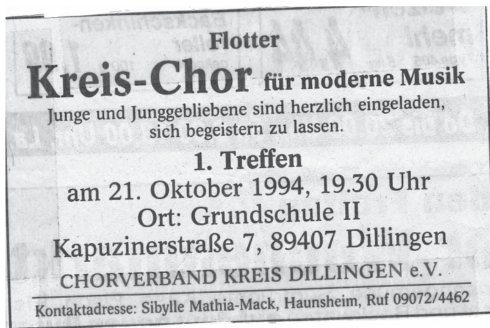
Zeitungsausschnitt „Erstes Treffen“

Der Kreischorverband Dillingen hatte per Zeitungs-Inserat „Junge und Junggebliebene“, die sich für moderne Musik interessierten und sich für einen „flotten Kreis-Chor“ begeistern könnten, eingeladen, an einem ersten Treffen in der Grundschule II in Dillingen teilzunehmen.